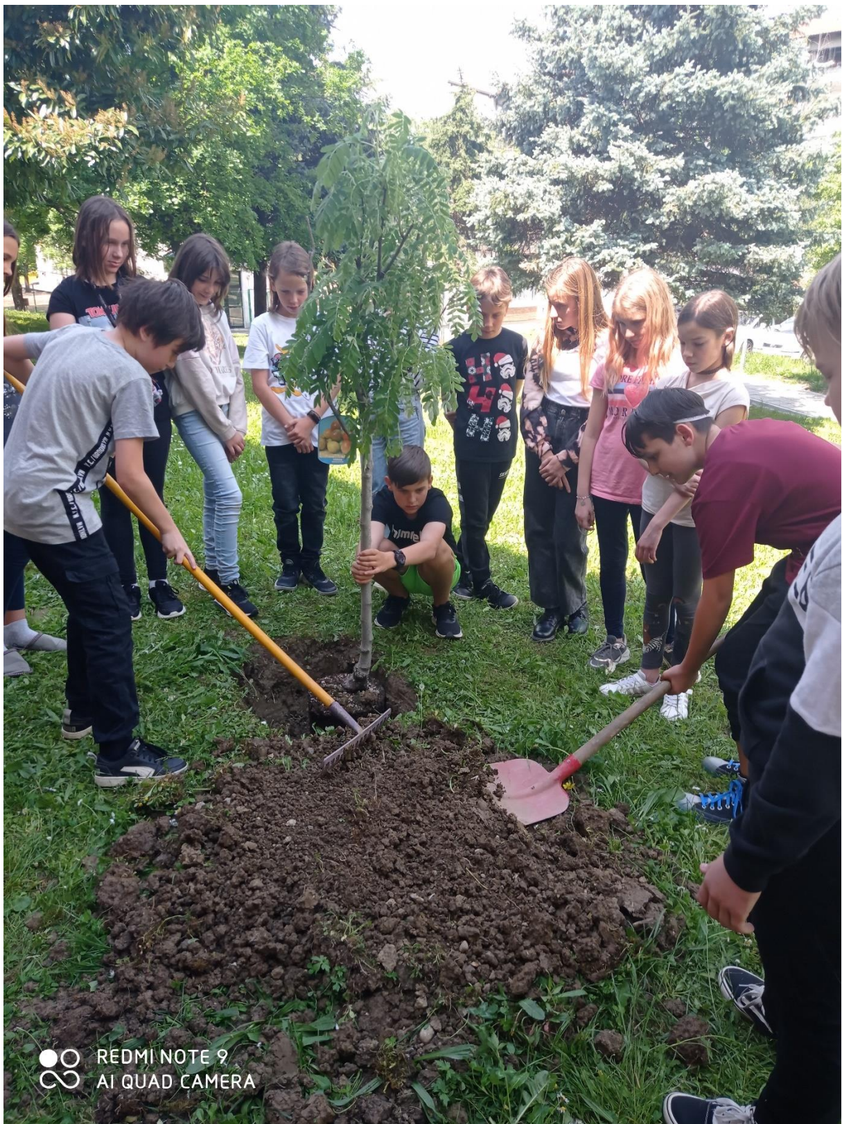
Posadili smo naše drevo ...